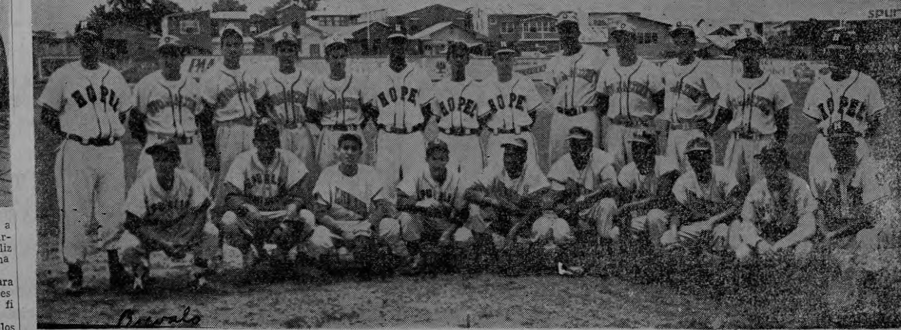
He aquí a los jugadores que han sido escogidos para integrar la Preselección Joseфина de Beisbol con miras a la participación en los Juegos de Chicago. La escogencia se hizo de acuerdo con los averages de cada uno en cuanto a bateo y fildeo